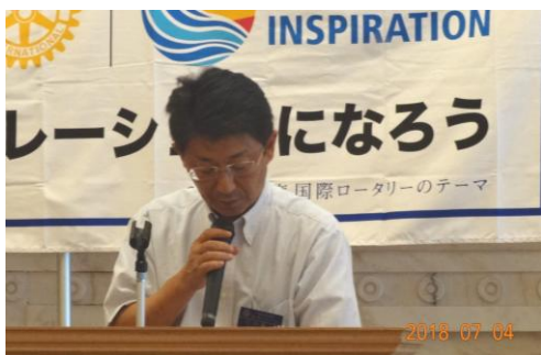
クラブ管理運営委員会