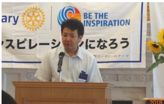
奉仕プロジェクト委員会