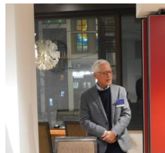
岸田喜好パスト会長