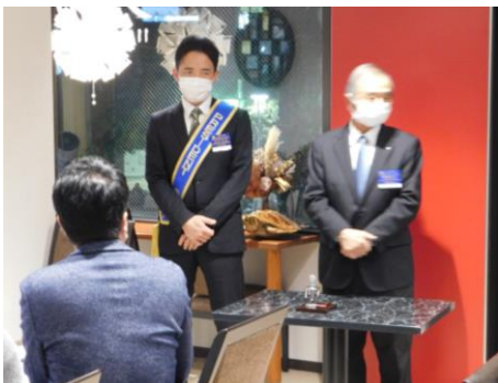
齊藤芳久市長挨拶